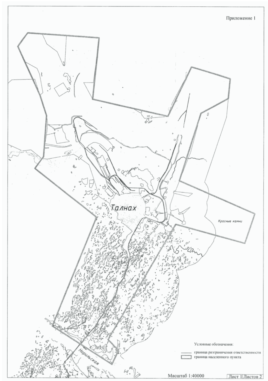
СХЕМА ГРАНИЦ ОСУЩЕСТВЛЕНИЯ МУНИЦИПАЛЬНОГО КОНТРОЛЯ ТАЛНАХСКИМ ТЕРРИТОРИАЛЬНЫМ УПРАВЛЕНИЕМ АДМИНИСТРАЦИИ ГОРОДА НОРИЛЬСКА