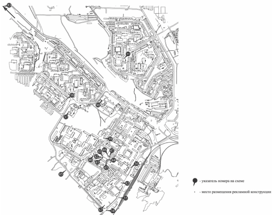
СХЕМА РАЗМЕЩЕНИЯ РЕКЛАМНЫХ КОНСТРУКЦИЙ. ГОРОД НОРИЛЬСК, РАЙОН ТАЛНАХ