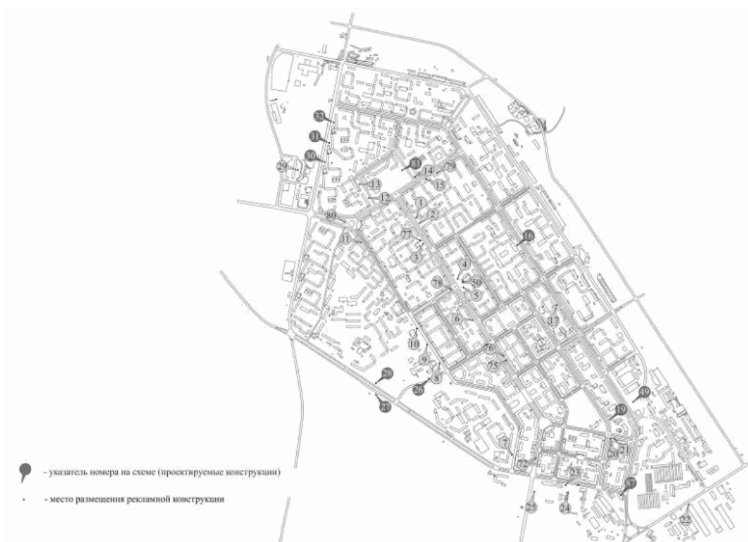
СХЕМА РАЗМЕЩЕНИЯ РЕКЛАМНЫХ КОНСТРУКЦИЙ. ГОРОД НОРИЛЬСК, РАЙОН ЦЕНТРАЛЬНЫЙ